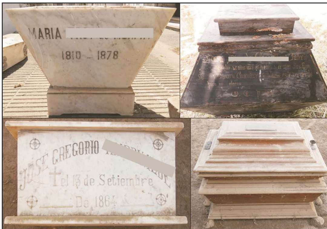
Figura 3. Ejemplos de urnas de mármol y madera que contenían los restos de los individuos incluidos en la colección.

En enero de 2018 se iniciaron las actividades de recuperación de restos humanos pertenecientes a pobladores de la zona fallecidos durante el periodo mencionado. Los restos mortales estaban depositados en urnas de mármol o madera, con diseños y acabados característicos de la época (Figura 3); en sus paredes externas presentan inscripciones con información valiosa sobre las personas fallecidas (i.e., nombre, fecha de nacimiento y defunción, filiaciones, etc.), lo cual permitió posteriormente rastrear la documentación oficial que certificara esos datos. Varias de ellas datan de antes de la apertura del cementerio, por lo que resulta factible que los restos hayan sido retirados del camposanto parroquial y/o de la segunda necrópolis, para ser posteriormente ubicados en las bóvedas familiares del nuevo cementerio.