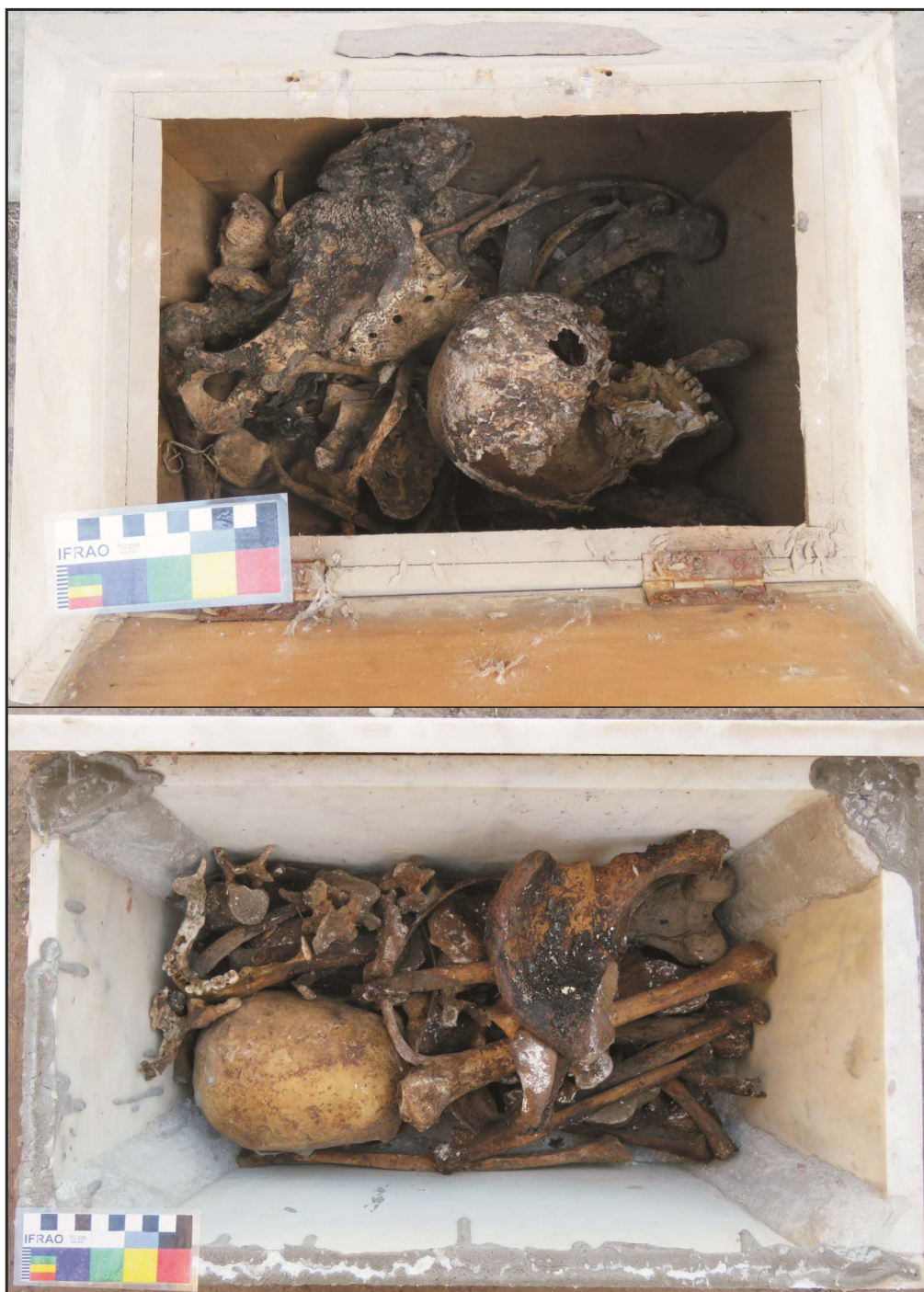
Figura 4. Disposición de los restos dentro de las urnas.

epidemias. Una vez retirados, los restos de cada una de las urnas fueron colocados para su transporte al laboratorio en bolsas plásticas, y estas, en cajas de cartón corrugado en cuyo exterior se consignó un número de inventario. También se incluyó un rótulo con ese mismo código en el interior de cada bolsa, seguido de toda la información disponible en las paredes externas de la urna correspondiente.