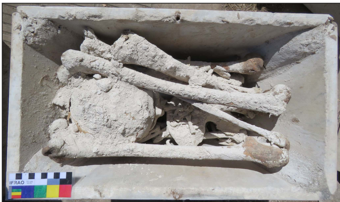
Figura 5. Aplicación de cal sobre los restos óseos.

Las actividades de laboratorio se han focalizado en la implementación de un plan integral de manejo que prioriza en el tratamiento de los restos humanos desde los principios de la bioética, los cuales establecen que los investigadores de campos disciplinares como la bioarqueología, la antropología biológica y la paleopatología tienen la responsabilidad de preservar y registrar los restos mortales para investigaciones futuras, ya que ofrecen información única e insustituible sobre la historia de la humanidad [63, 66]. Por ese motivo, una premisa central del equipo de investigación es la generación y reproducción de una actitud que privilegie el manejo respetuoso y la preservación de la identidad de los individuos [67], así como la implementación de un programa de conservación tanto curativa como preventiva que consta de los siguientes pasos: 1) ventilación de los restos para eliminar la humedad; 2) documentación fotográfica de todo el proceso, desde la apertura de la caja de transporte hasta las etapas de limpieza y guarda definitiva; 3) toma de muestras de sedimento, puparios (Figura 6), uñas, restos de cal y cabello, etc; 4) limpieza mecánica con cepillos de diferente dureza; 5) tratamiento con agua destilada en los