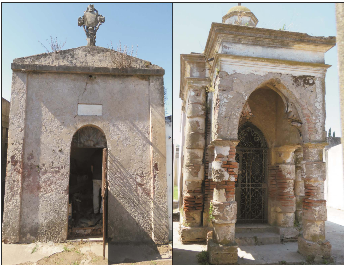
Figura 2. Bóvedas en las cuales se encontraban los restos recuperados

Originariamente, el Cementerio Municipal ocupaba un área de 150 m de ancho por 100 de largo aproximadamente, y en el camino principal se ubicaban las bóvedas pertenecientes a las familias más destacadas de la ciudad, algunas de las cuales aún se mantienen en pie (Figura 2), así como también varias sepulturas y mausoleos de inmigrantes españoles, italianos e irlandeses, manifestaciones arquitectónicas y simbólicas de gran importancia para el acervo patrimonial histórico de la ciudad y sus habitantes. Hacia la mitad del sendero se destaca aún hoy día la Cruz Mayor, que presenta diversos símbolos masónicos, y en uno de sus extremos se emplaza el Osario General, que originalmente correspondió a la sepultura del reconocido gaucho Juan Moreira [60].